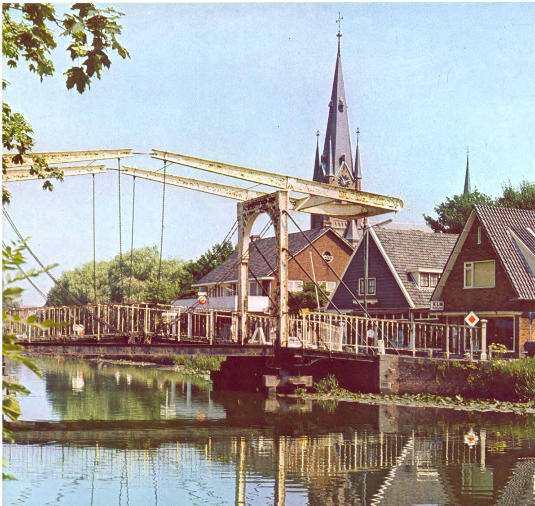
De oude Reevaart in Nederhorst den Berg

- De Reevaart terug in Nederhorst den Berg Door het aanleggen van de Reevaart in Nederhorst den Berg, wordt de historische ontsluiting van deze kern teruggebracht. Daarnaast geeft deze verbinding de mogelijkheid tot het varen van een zeer gevarieerd rondje via de Vecht.