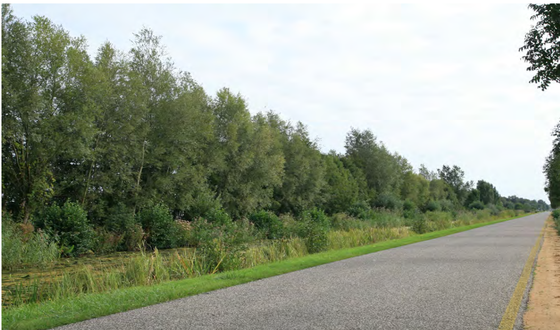
Begroeiing langs de Nieuwe Weg, achter de bomen de Vijfde Plas

Watersport is de belangrijkste vertegenwoordiger binnen de recreatieve sector. Dit heeft als gevolg dat de recreatie binnen Wijdmeren erg seizoengebonden is. Het is jammer dat er vanaf de weg nauwelijks kans is om het water 'te beleven'. Dit wordt o.a. veroorzaakt door heggen en schuttingen die het zicht op het water tegengaan. Langs de doorgaande regionale wegen gaat het echter vooral om beplanting en kunnen er dus doorzichten gecreëerd worden op het water. Voornamelijk de N201 en de Nieuwe Weg bieden hier mogelijkheden toe.