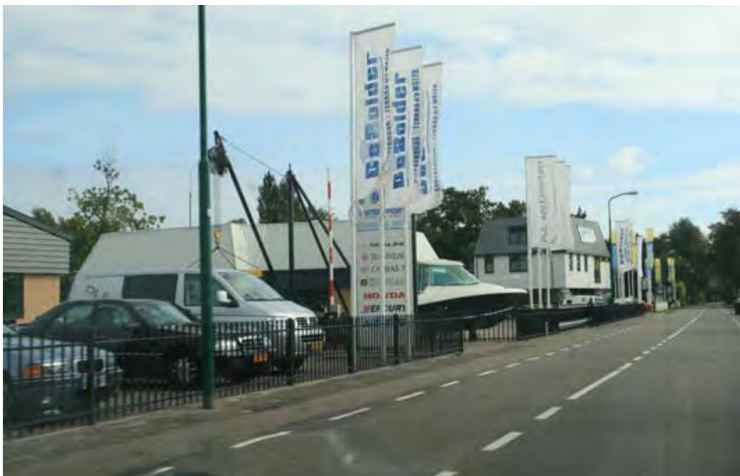
Jachthavens: een overmaat aan reclame en gestalde boten

De uitstraling van de Oud-Loosdrechtsedijk is sleets, rommelig en onaantrekkelijk. De openbare ruimte wordt gekenmerkt door geparkeerde auto's, hekken, reclame-uitingen, vlaggen en uitgestalde boten op trailers. Ruimte voor de voetganger ontbreekt vaak binnen het smalle profiel.