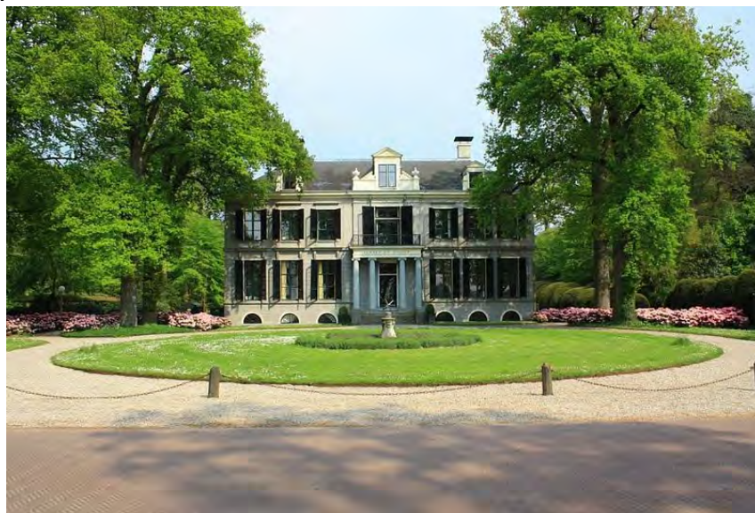
Landgoed Schaep en Burgh

Een aantal landgoederen is in eigendom van Natuurmonumenten, Gooilust (hoofdkantoor NM) en de 17 e eeuwse boerderij Brambergen (bezoekerscentrum NM). Veel andere landgoederen zijn particulier eigendom. Voor toeristen en recreanten vormen de landgoederen een prachtig gezicht, maar helaas kunnen zij in veel gevallen de landgoederen niet betreden.