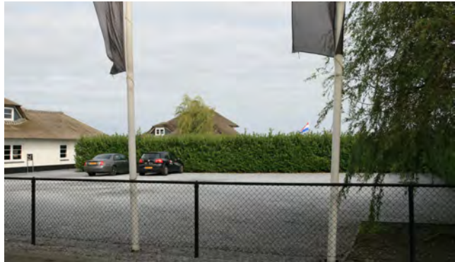
Geen zicht op het water door hagen

Wanneer er bijvoorbeeld over de Nieuw-Loosdrechtsedijk wordt gereden, zijn de plassen vrijwel onzichtbaar door hekwerken en hagen.