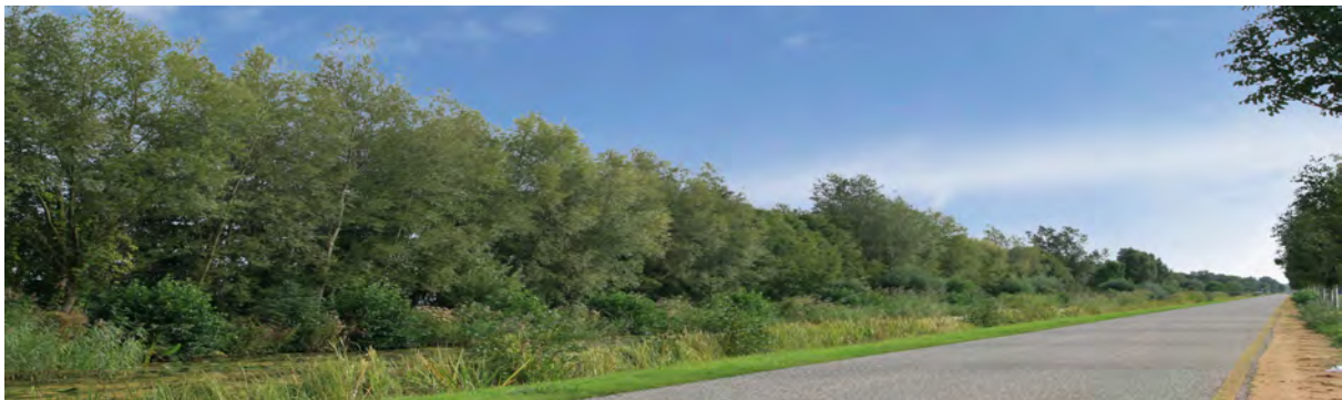
Huidige situatie Nieuwe weg

Voornamelijk langs de N201 en de Nieuweweg in Breukeleveen wordt het zicht op het water ontnomen door dichte begroeiing.