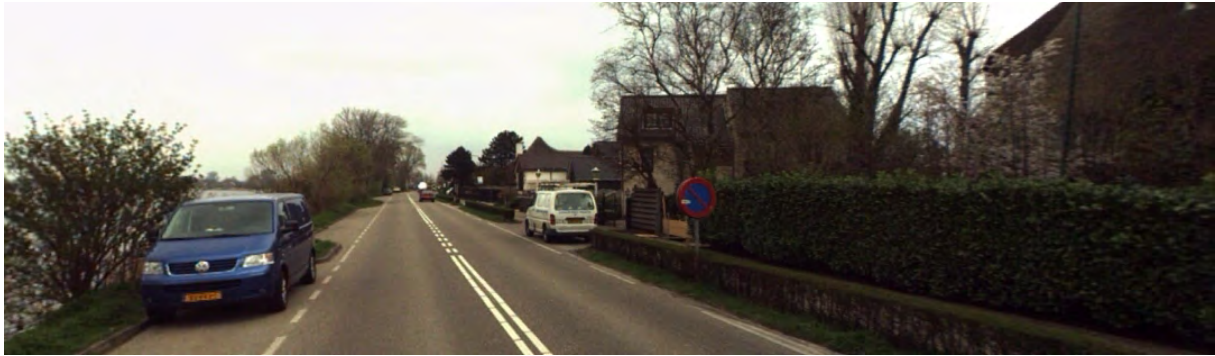
Hagen en geparkeerde auto's maken de Veendijk onoverzichtelijk

Vooraf op het moment dat bewoners van hun eigen terrein rijden, kunnen er gevaarlijke situaties ontstaan. Door de hagen hebben zij slecht zicht op het fietspad, dit wordt verergerd door mogelijk geparkeerde auto's.