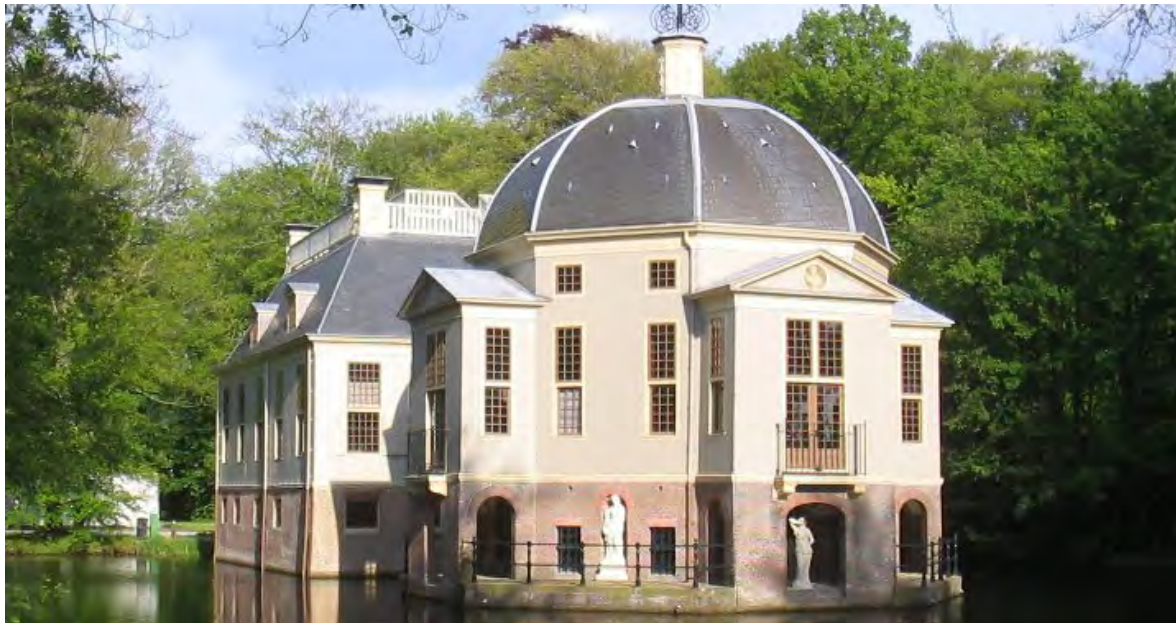
Trompenburg in 's-Graveland

De kernen worden versterkt op het moment dat de eigen karakters van de kernen een impuls krijgen.