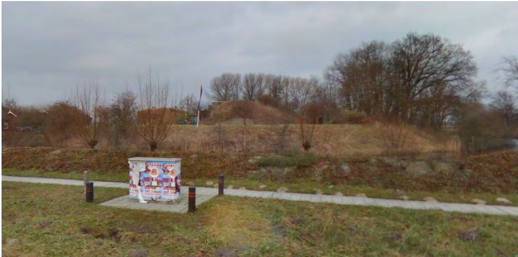
Het beperkte zicht op Fort Kijkuit

Fort Kijkuit is onderdeel van de Hollandse Waterlinie. Het heeft een bomvrij wachthuis uit 1844, een geschutopstelling, schietsleuven en een negentiende-eeuws kruitmagazijn. In 1933 is er een moderne kazemat van gewapend beton bij gebouwd. Op dit moment is fort Kijkuit een onopvallend gebouw, verscholen onder en achter een dikke laag begroeiing.