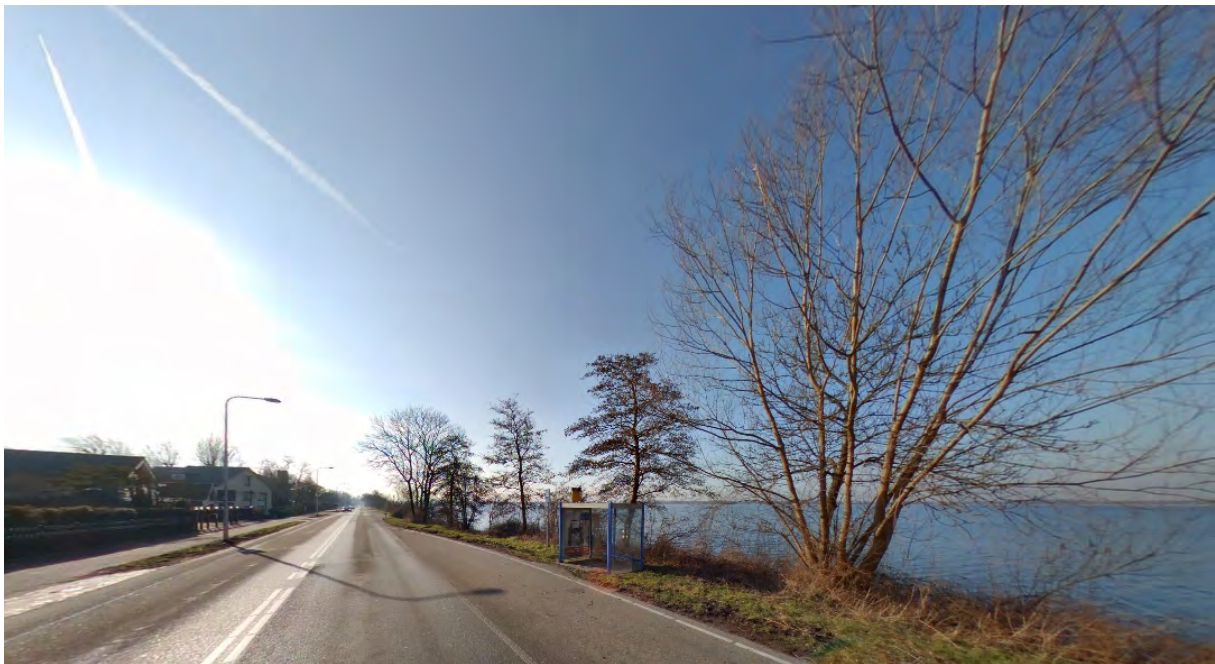
Situatie op de Veendijk

Wanneer er op de nieuw aan te leggen dijk een fietspad gecreëerd kan worden, ontstaat er niet alleen een fietspad op een prachtige locatie, maar ook de ruimte om de Veendijk opnieuw in te richten. Het fietspad kan op de bestaande locatie verdwijnen waardoor er ruimte ontstaat voor een nieuwe inrichting van de weg en het creëren van parkeervoorzieningen.