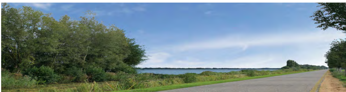
Impressie met zicht op het water

Het maken van zichtlijnen of vizieren over het water kan eenvoudig gerealiseerd worden door op strategische plekken de beplanting te verwijderen. De plassen worden daarmee zichtbaar voor bezoekers bij hun eerste kennismaking met het gebied.