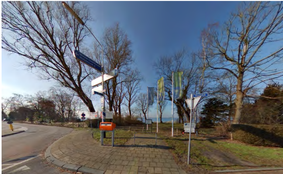
Geschikte locatie voor een boulevard met parkeergelegenheid

In de gemeente Wijdmeren komen veel recreanten en toeristen om met een boot van het water en de rust te genieten. Naast de watersporters zijn er echter ook veel personen die hier fietsen, of met de auto op weg zijn. Om ook voor deze personen mogelijkheden te creëren om te genieten van het water, zou er een boulevard gemaakt kunnen worden nabij het kruispunt Oud-Loosdrechtsedijk – Horndijk – Veendijk.