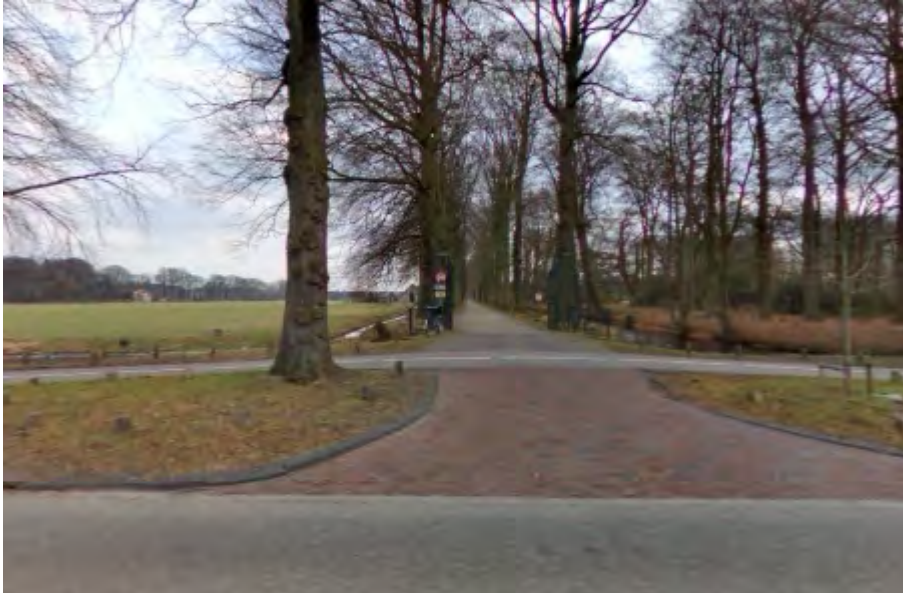
Kenmerkend voor 's-Graveland: Oprijlaan met lange rij bomen

's-Graveland beschikt over een aantal prachtige landgoederen. Rijke kooplieden uit Amsterdam bouwden hier begin 1600 prachtige landhuizen, vanzelfsprekend met een parkachtig bos met chique lanen als achtertuin. Iedere buitenplaats heeft zijn eigen bijzonderheden. Schaep en Burgh en Spanderswoud hebben een bijzondere slangenmuur en Gooilust heeft een geurige siertuin met exotische bomen, struiken en bloemen. Veel van deze landgoederen bestaan uit grote nostalgische gebouwen met mooi onderhouden tuinen en oprijlanen met lange rijen bomen.