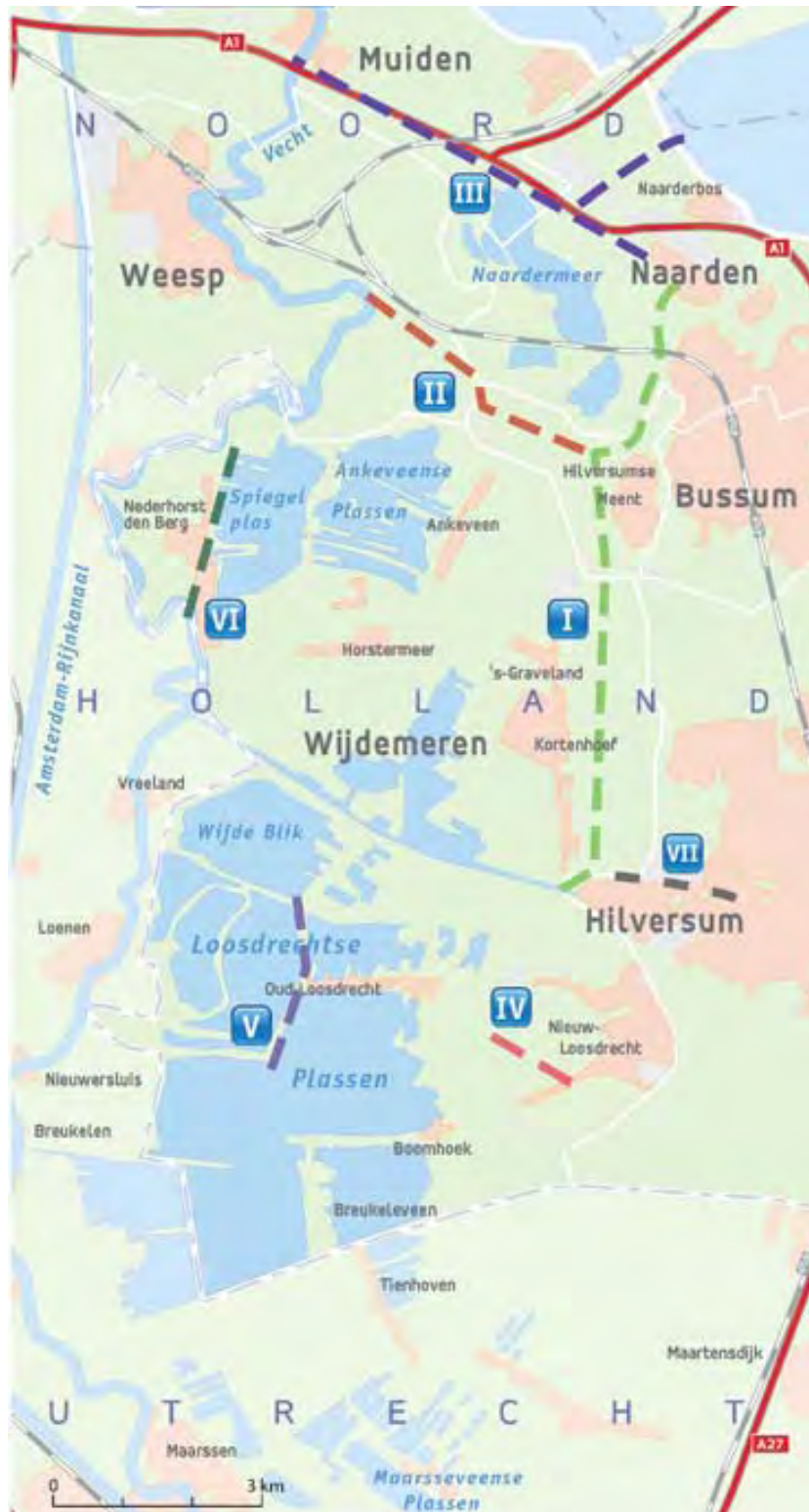
Overzicht projecten 'Vaart in de Vaart'

Op de bovenstaande kaart staan de projecten van 'Vaart in de Vaart' weergegeven. De projecten binnen Wijdmeren zijn: